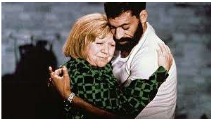
Strach zżerać duszę (1974)

Wykład będzie poświęcony różnym wymiarom niemieckiego kina (post)migracyjnego – czasowemu, etniczemu, generacyjnemu itd., rodzajom narracji i sposobom konstruowania świata przedstawionego oraz możliwemu wpływowi tej twórczości na kształtowanie się świadomości społecznej u jej odbiorców.