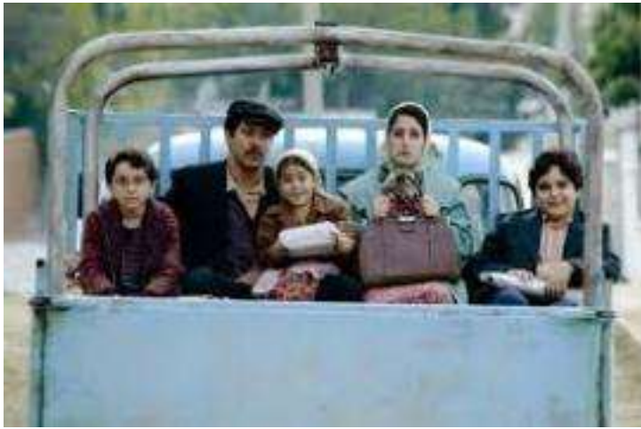
Almánya – Witajcie w Niemczech (2011)